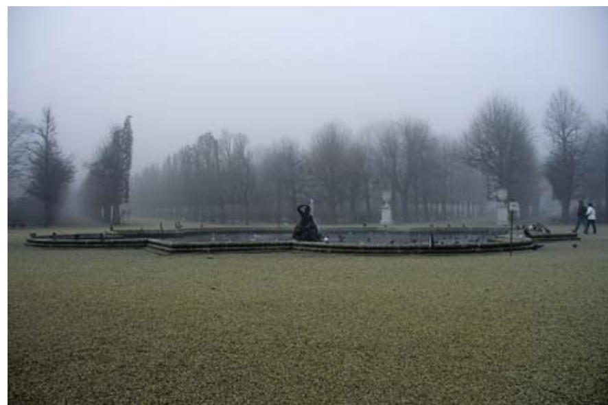
Горе: План на градината на двореца Шонбрун; Звездовидният фонтан и тръгващите от него алеи, фланжирани със силно подрязана растителност Вдясно: Детайл от стъклено-металната конструкция на Палмовата къща