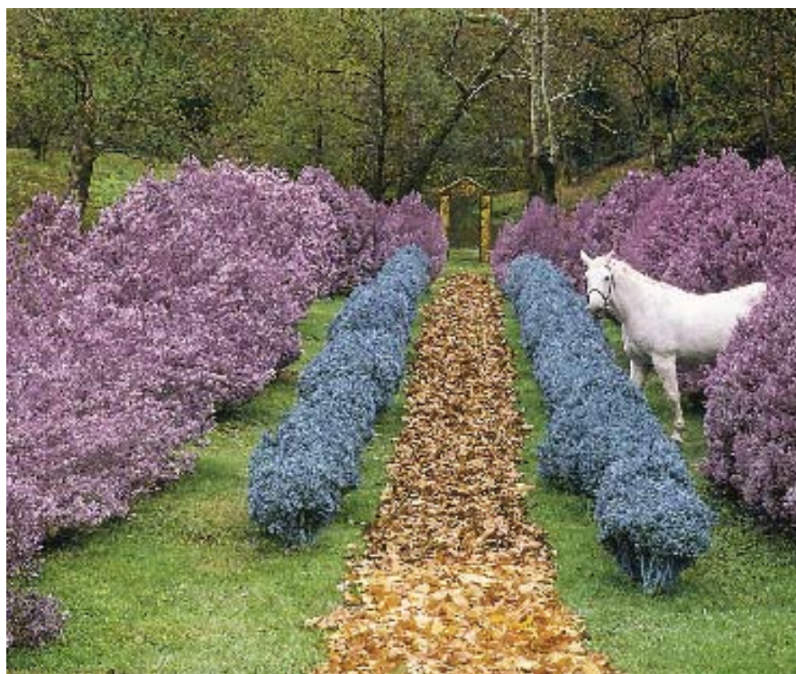
Дръзката градина на Тори Уинкълър