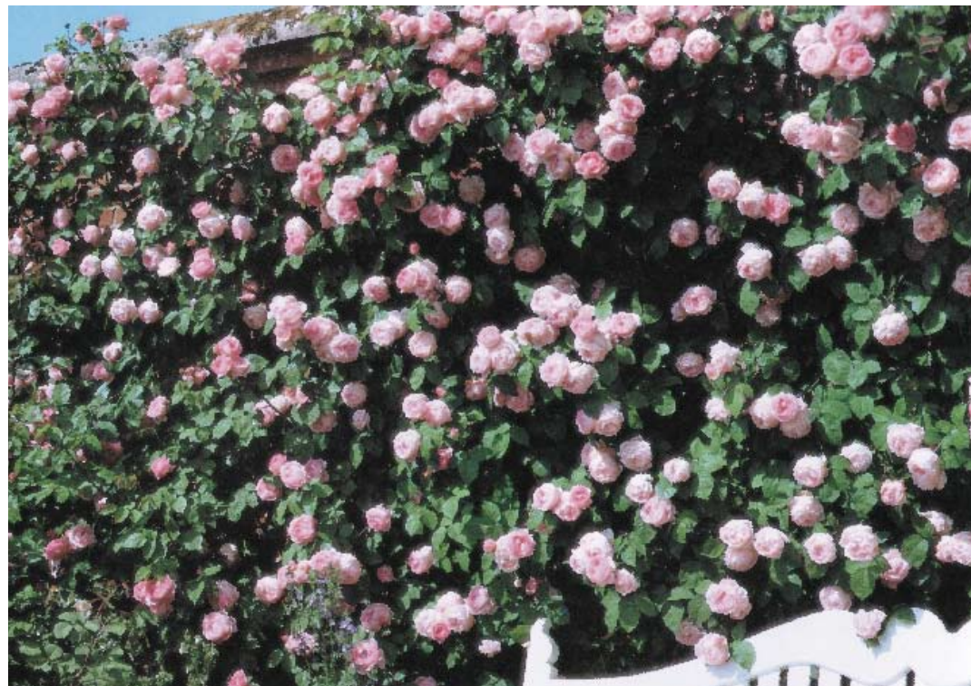
Розата носи короната си още от древността. Хилядите ѝ превъплъщения населяват градините от най-северните райони до тропиците.